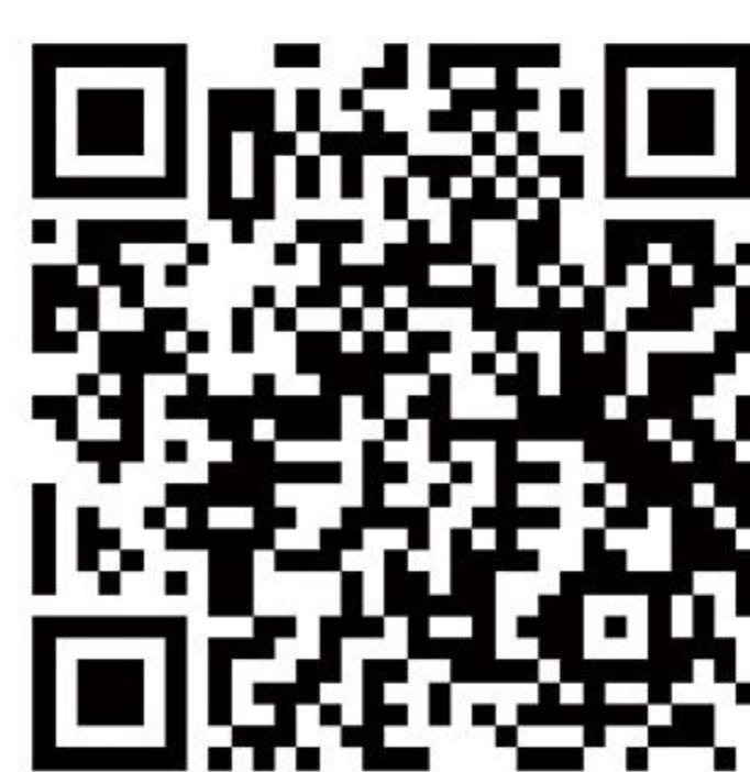
能力认证与就业直通工程